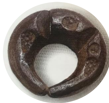
รูปที่ ๓ เงินพดด้วง ๑ ตำลึง