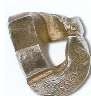
รูปที่ ๙ เงินเจียงน่าน

ระยะถดถอย เป็นระยะที่บ้านเมืองอยู่ในสภาพตกต่ำอย่างรุนแรง เมื่อพญาแก้วสิ้นพระชนม์ใน พ.ศ. ๒๐๖๘ ปัญหาการสรรหากษัตริย์ที่เหมาะสมมาครองเมือง ขุนนางแตกแยกเกิดความระส่ำระสาย และหลังจากที่เชียงใหม่ตกเป็นเมืองขึ้นของพม่าในปี พ.ศ. ๒๑๐๑ เศรษฐกิจการค้าตกต่ำ การผลิตเงินเจียงออกมาใช้จึงลดน้อยลงเรื่อยๆ ในช่วงนั้นจึงมีการใช้เงินเจียงที่ผลิตขึ้นในระยะเฟื่องฟูควบคู่ไปกับเงินตราของพม่า