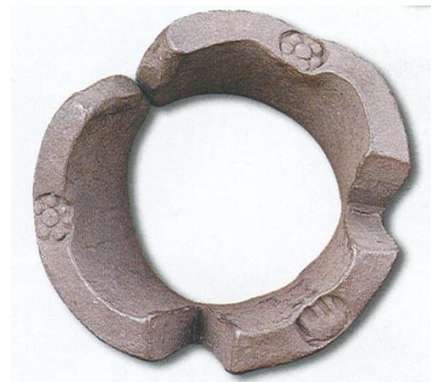
รูปที่ ๖ เงินเจียงยุคแรก

ระยะเฟื่องฟู เป็นระยะที่บ้านเมืองเจริญรุ่งเรืองทั้งทางด้านเศรษฐกิจการค้า การเมือง การปกครอง จัดว่าเป็นยุคทองของอาณาจักรล้านนา และเป็นช่วงที่มีการผลิตเงินเจียงใช้มากที่สุด ซึ่งในการผลิตเงินเจียงเพื่อให้มีปริมาณมากในเวลาอันจำกัดนั้น ทำให้เกิดการเปลี่ยนแปลงรูปร่างของเงินเจียงด้วยและตัวอักษรบนเงินเจียงด้วย