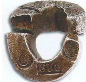
รูปที่ ๘ เงินเจียงพะเยา