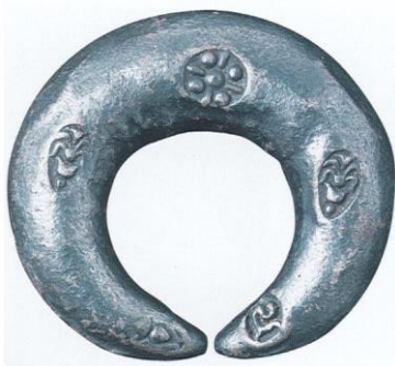
รูปที่ ๔ เงินเจียงชากลม

ระยะแรกและพัฒนาการ ตั้งแต่สมัยพญามังรายสถาปนาอาณาจักรล้านนา พ.ศ. ๑๘๓๙ จนถึงรัชกาล พญาเกีอานา พ.ศ. ๑๘๙๘ - ๑๙๒๘ เป็นระยะที่เริ่มวางรากฐาน กำหนดรูปแบบจนเป็นเงินกำไลขาเหลี่ยม และใช้ตัวอักษรสุโขทัยปรากฏเป็นชื่อเมืองต่างๆ บนเงินกำไลขาเหลี่ยมต้นแบบ และพัฒนามาใช้ตัวอักษรฝักขามในเวลาต่อมา