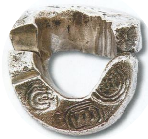
รูปที่ ๗ เงินเจียงเชียงใหม่

ระยะเฟื่องฟู เป็นระยะที่บ้านเมืองเจริญรุ่งเรืองทั้งทางด้านเศรษฐกิจการค้า การเมือง การปกครอง จัดว่าเป็นยุคทองของอาณาจักรล้านนา และเป็นช่วงที่มีการผลิตเงินเจียงใช้มากที่สุด ซึ่งในการผลิตเงินเจียงเพื่อให้มีปริมาณมากในเวลาอันจำกัดนั้น ทำให้เกิดการเปลี่ยนแปลงรูปร่างของเงินเจียงด้วยและตัวอักษรบนเงินเจียงด้วย