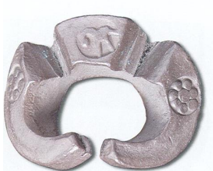
รูปที่ ๕ เงินเจียงต้นแบบ