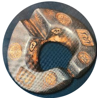
รูปที่ ๒ เงินเจียง ๕ เงิน

นอกจากตรามาตรฐานเหล่านี้แล้ว ยังมีตราที่ตอกไว้ระหว่างปลายขาเงินเจียงทั้ง ๒ ด้านเรียกว่า “ตราปลายขาใน” ซึ่งเป็นตราพิเศษที่ตอกไว้กับเงินเจียงปลอม และเนื่องจากอาณาจักรล้านนามีการติดต่อค้าขายกับอาณาจักรข้างเคียงโดยเฉพาะอาณาจักรสุโขทัย จึงมีการทำเงินเจียงให้มีน้ำหนักเป็นมาตรฐานที่ใช้ซื้อขายแลกเปลี่ยนสินค้าระหว่างกันได้โดยสะดวก กำหนดให้ ๑ เงินล้านนา มีค่าเท่ากับ ๑๒ กรัม และเงินเจียงขนาด ๕ เงินจึงมีมูลค่าเท่ากับเงินพดด้วงของสุโขทัย ขนาด ๑ ตำลึง (๖๐ กรัม)